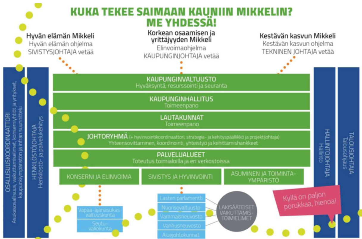
Kuvio 1: Mikkelin kaupungin strategia

Strategisten ohjelmien seuranta ja raportointi valtuustolle toteutetaan valtuuston hyväksymien seurantamittareiden avulla erillisenä raportointina. Valtuustotason seurantamittareiden tavoitetaso on asetettu valtuustokaudeksi.